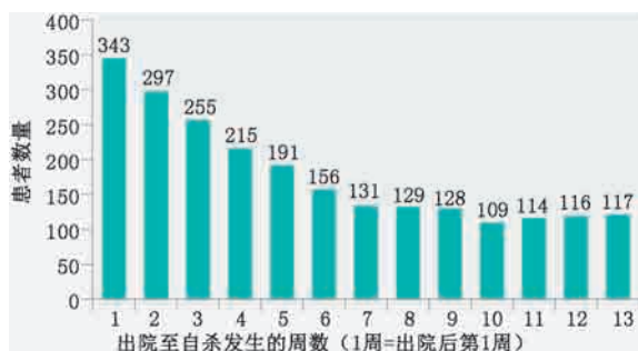
图2 2003—2013年,英国精神疾病患者在出院每周的自杀数量 27

评估的建议,但还没有广泛接受的医疗标准。而风险评估的内容也同样是个难题。风险评估往往是风险评估工具和量表的代名词,充其量代表了可以向患者询问自杀观念和计划的过程。风险评估常在急诊或特定的精神心理部门进行,大约30%的美国成年人在实施自杀前曾就诊于初级医疗保健中心 36 ,但这些机构却没有特别重视自杀风险评估。